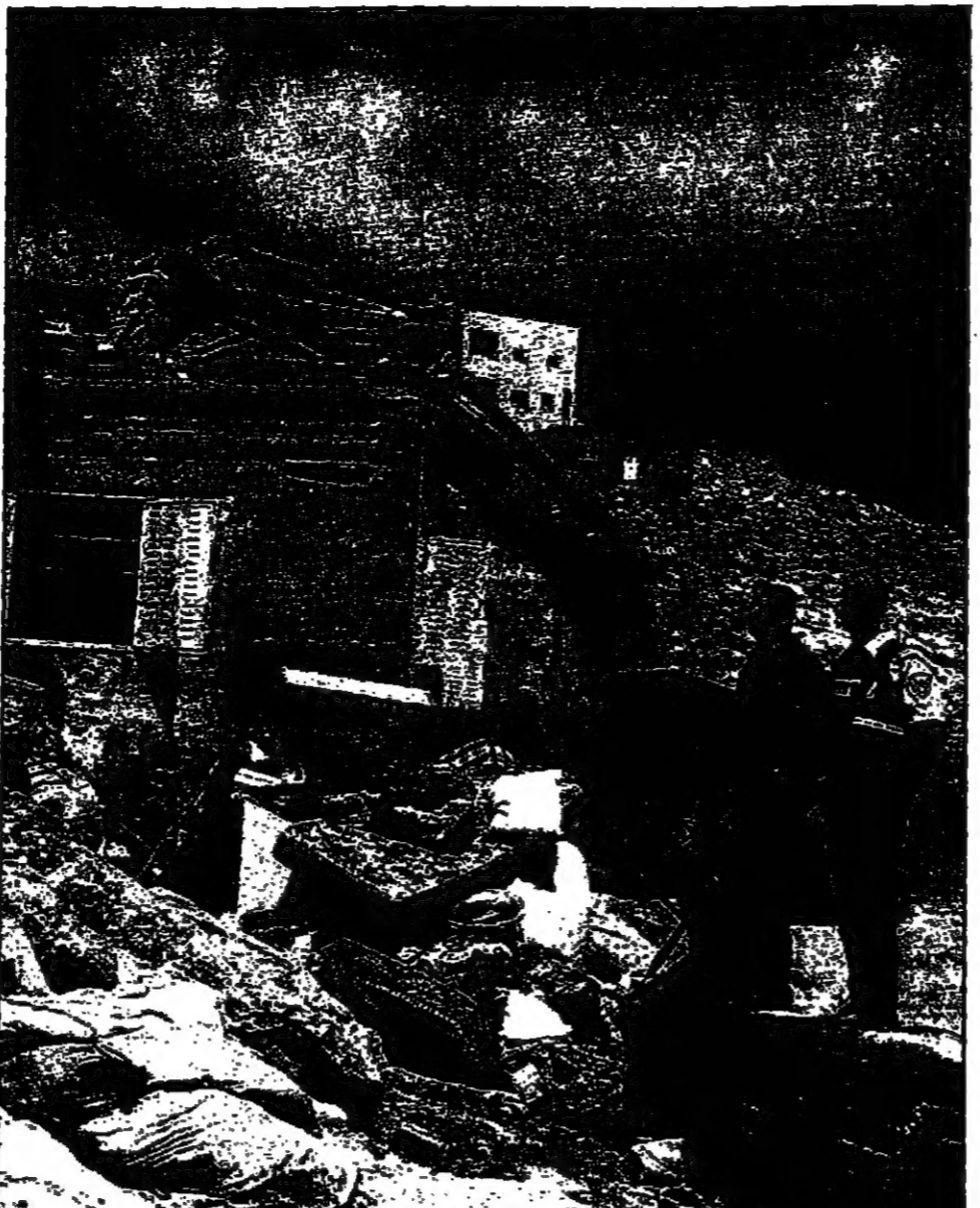
جنود اسراييل يربون هدم أحد المنازل القريبة في القدس